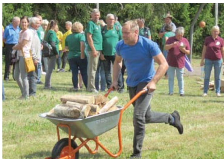
Svarbu ir greitis, ir kad malkos neiškristų.