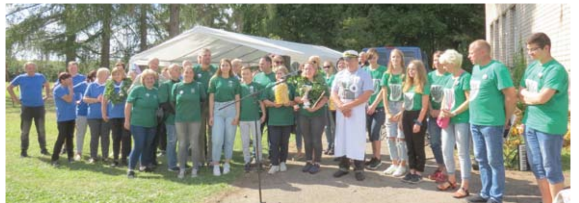
Visų trijų vietų nugalėtojai. Centre - pirmosios vietos laimėtojai Leliūnų bendruomenė, dešinėje - antrąją vietą užėmusi Traupio bendruomenė, kairėje - tretį likę Levaniškių bendruomenės atstovai.

Ne vienas svečias, sakydamas sveikinimo kalbą, pabrėžė tai, kaip svarbu jausti vienas kito paramą, palaikymą, pritarimą, o svarbiausia, kad kiekvienos bendruomenės priekyje visada būna iniciatorius, gerų idėjų skleidėjas, bendrystės kūrėjas, prasmingų susibūrimų rengėjas - bendruomenės pirmininkas. Būtent jie - pirmininkai - kultūrinei ir bendruomeninei veiklai nepailsdami aukoja daugiausia savo laisvalaikio.