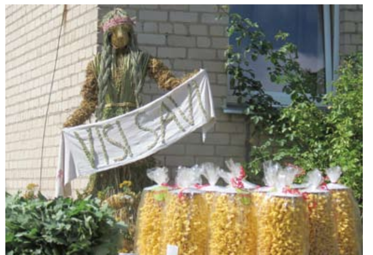
Kiekviena dalyvavusi bendruomenė namo parsivežė po šakotį.

Bendruomenių prisistatymas, sportinių varžybų rezultatai bei atsivežtų vaišių vertinimas ir lėmė, kas taps geriausia šių metų rajono bendruomene. Varžytuvėse iš viso dalyvavo 10 bendruomenių.