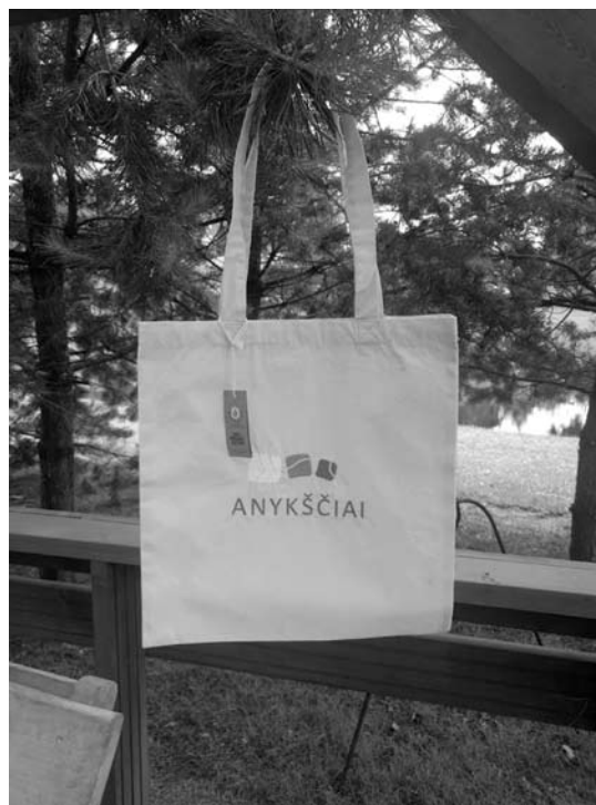
Daugelį darbų puošia Anykščių miesto prekinis ženklas.

Mažoji bendrija „Siuvinėjimo upė“ jau turi savo internetinę parduotuvę, kurioje galima įsigyti marškinėlių, kepurėlių, pirkinų